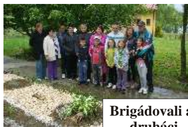
Brigádovali aj druháci z 2.A triedy,...