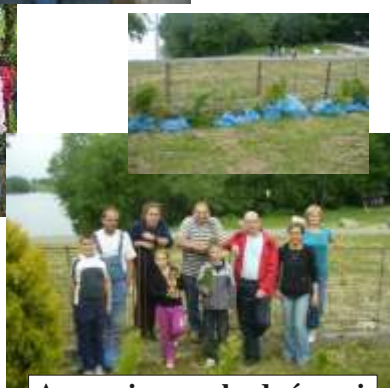
A nesmieme zabudnúť ani na štvrtákov zo 4.A triedy.