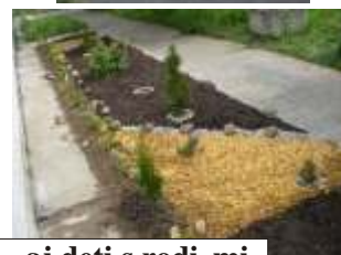
... aj deti s rodičmi z 2.B triedy