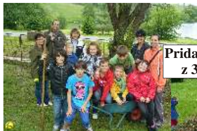
Pridali sa aj tretiaci z 3.A triedy, ...