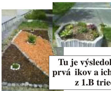
Tu je výsledok práce prvákov a ich rodičov z 1.B triedy.