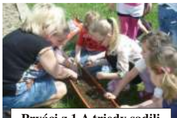
Prváci z 1.A triedy sadili do válovvov liečivé bylinky.