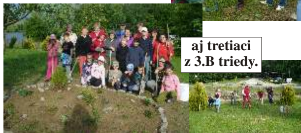
aj tretiaci z 3.B triedy.